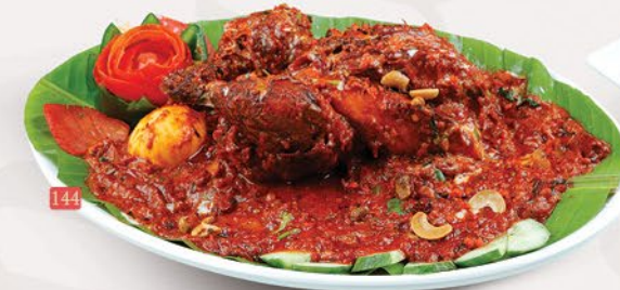
144 دجاج منواتي MANAVATTY CHICKEN ₪ 35.00 WITH 2 PCS. ASSTD. BREAD