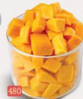
480 مانجو MANGO ₹ 15.00