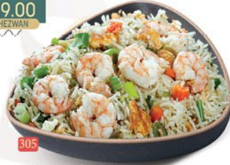
305 ارز مقلبي روبيان PRAWNS FRIED RICE ฿ 18.00 ฿ 19.00 SCHEZWAN