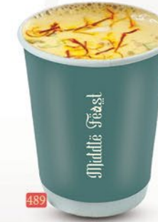
489 حليب بادام BADAM MILK ₹ 3.00