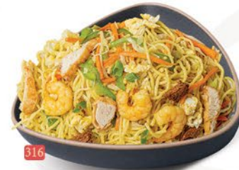
316 معدرنة مشكل MIX NOODLES ฿ 19.00 ฿ 20.00 SCHEZWAN