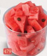
479 بطيخ WATERMELON ₹ 12.00