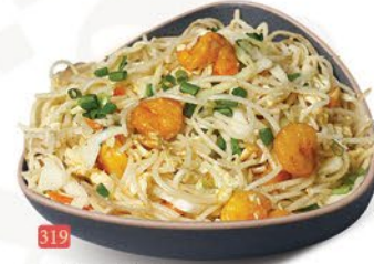
319 معدرنة روبيان PRAWNS NOODLES ฿ 19.00 ฿ 20.00 SCHEZWAN