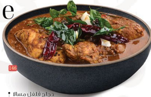
146 دجاج فلفل مسالا PEPPER CHICKEN MASALA ₹ 15.00