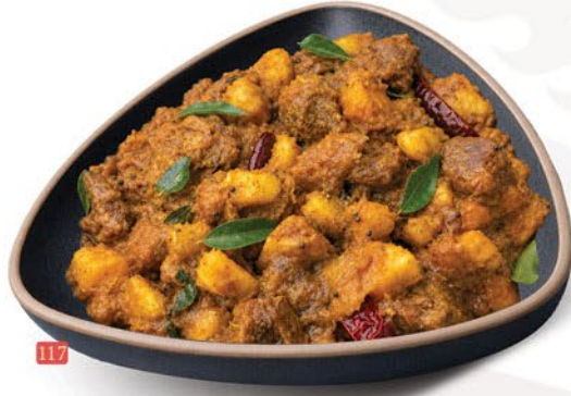
117 كبا برياني دجاج/لحم بقر KAPPA BIRIYANI CHICKEN/BEEF ₪ 15/16