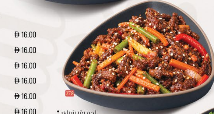
لحم بقر شيلي CHILLI BEEF ₹ 18.00