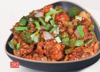
سمك مانشوريان FISH MANCHURIAN ₹ 20.00