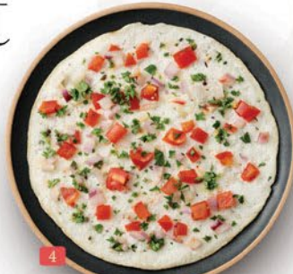
اوتاپم پھل / طماطم ONION/TOMATO UTHAPPAM ₹ 6.00