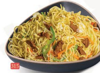
315 معدرنة لحم بقري BEEF NOODLES ฿ 17.00 ฿ 18.00 SCHEZWAN