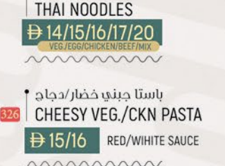
326 باستا جبني خضار/دجاج CHEESY VEG./CKN PASTA ฿ 15/16 RED/WHITE SAUCE