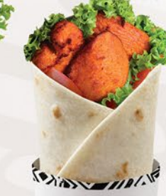
راب زنجير ZINGER WRAP ₹ 15.00