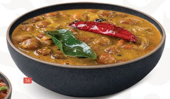
کدالا کاري KADALA CURRY ₹ 6.00