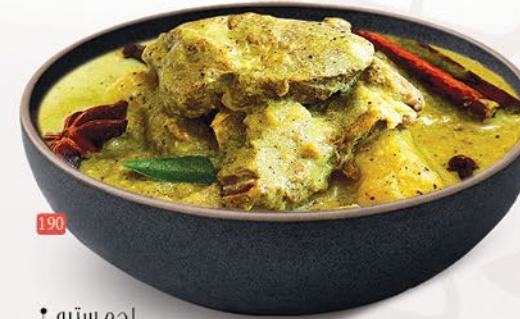
190 لحم ستيو MUTTON STEW ₹ 19.00