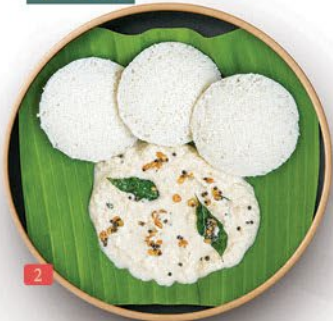
ايدلي سيت (3 قطع) IDLY SET ( 3 PCS ) ₹ 5.00