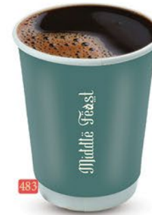
483 قهوة اسود BLACK COFFEE ₹ 2.00