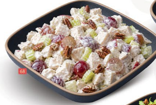
سلطة دجاج فالدورف WALDORF CHICKEN SALAD ₹ 13.00