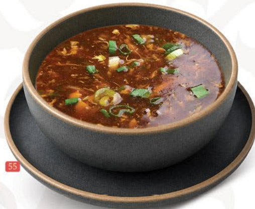
شوربة حار و حامض خضار/دجاج HOT & SOUR SOUP VEG./CHICKEN ₹ 9/10