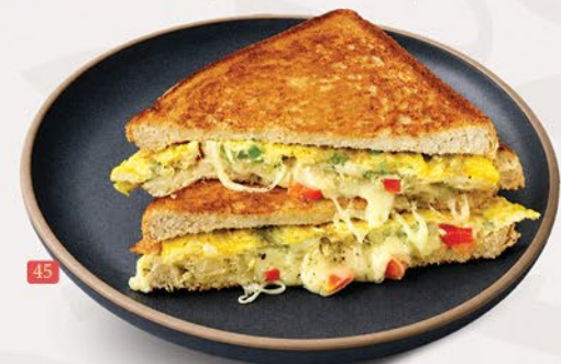
ساندوتش خبز بيض مقلي BREAD OMELETTE SANDWICH ₹ 6.00