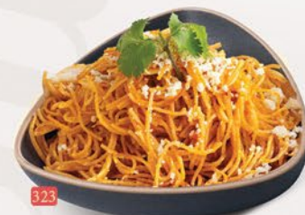
323 معدرنة مكسيكي MEXICAN NOODLES ฿ 14/15/16/17/20 VEG/EGG/CHICKEN/BEEF/MIX