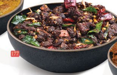
177 لحم بقر كوكونت مقلي BEEF COCONUT FRY ₹ 17.00