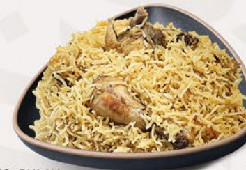
إراتشي شورو دجاج/لحم بقر IRACHI CHORU CHICKEN/BEEF ₹ 15/16