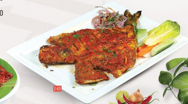
145 تاوا سي بريم (كانتاري/كاشميري) SEABREAM TAWA (KANTHARI / KASHMIRI) ₪ APS