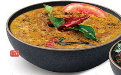
176 لحم بقر مباس/ستيو BEEF MAPPAS/STEW ₹ 17.00