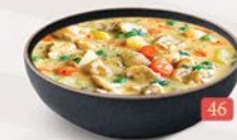
APPAM / KALLAPPAM CHI. STEW COMBO ₹ 14.00