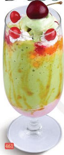
461 رويال فالوده ROYAL FALOODA ₹ 14.00