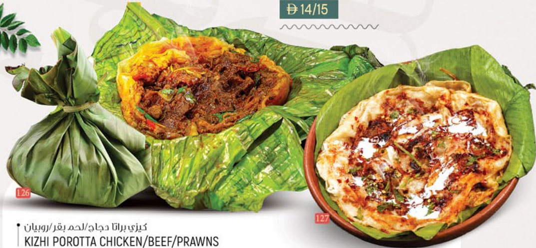
126 كيزي براتا دجاج/لحم بقر/روبيان KIZHI POROTTA CHICKEN/BEEF/PRAWNS ₪ 15/16/18