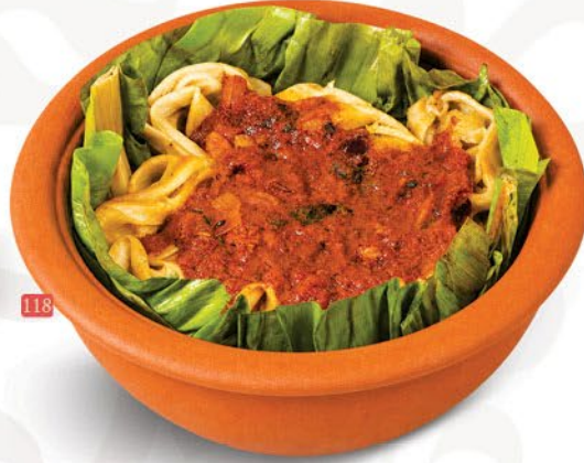
118 دم براتا DUM POROTTA ₪ 24.00