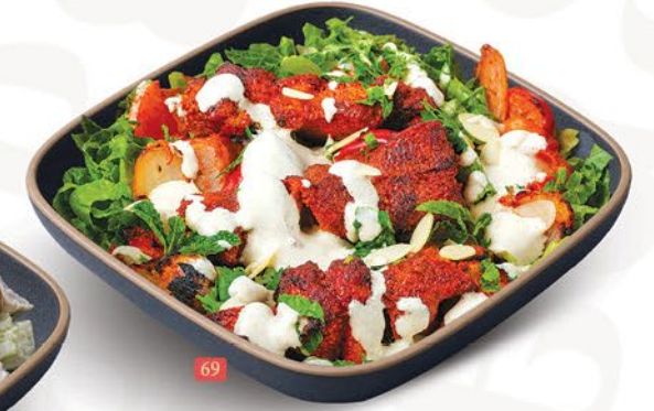
سلطة دجاج تكا CHICKEN TIKKA SALAD ₹ 12.00