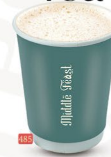
485 هورليكنس HORLICKS ₹ 4.00