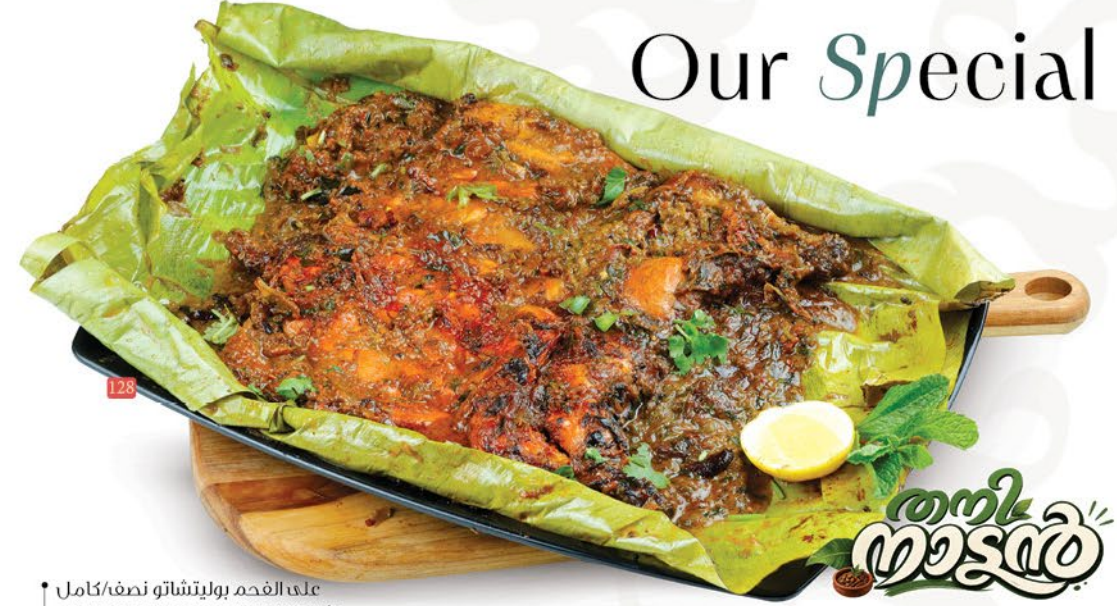
128 على الفحم بوليتشاتو نصف/كامل CHARCOAL POLLICHATHU H/F ₪ 26/48

Kizhi Porotta is a traditional South Indian delicacy (originating from Kerala) where flaky, layered parottas are stacked with spiced meat or egg curry, wrapped tightly in a banana leaf packet, and steamed or grilled.