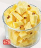
478 أناناس PINEAPPLE ₹ 15.00