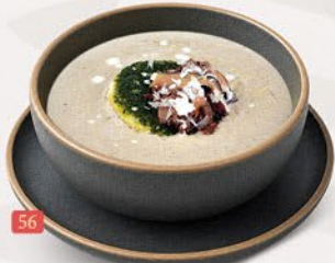
شوربة كريم من فطر CREAM OF MUSHROOM SOUP ₹ 10.00

Soup is a primarily liquid food made by simmering ingredients like meat, fish, or vegetables in stock, water, or milk. Ranging from light, delicate broths to thick, hearty purées, soups are a comforting, highly customizable staple served hot, warm, or chilled.