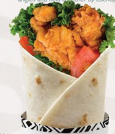
راب قطع NUGGETS WRAP ₹ 12.00