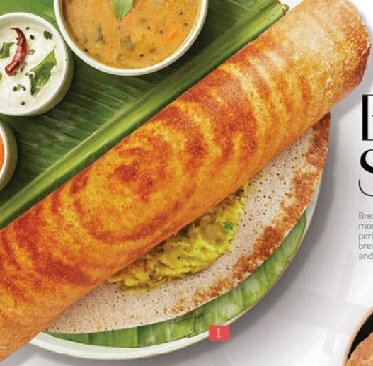
مسالا دوسا MASALA DOSA ₹ 7.00

Breakfast is the first meal of the day usually eaten in the morning. The word in English refers to breaking the fasting period of the previous night. Various "typical" or "traditional" breakfast menus exist, with food choices varying by regions and traditions worldwide.