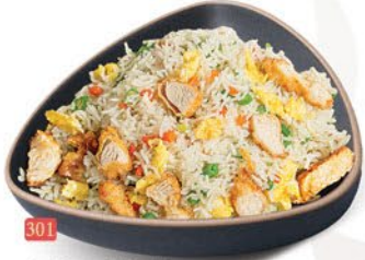
301 ارز مقلبي دجاج CHICKEN FRIED RICE ฿ 15.00 ฿ 16.00 SCHEZWAN

Fried rice is a classic Asian dish made by stir-frying cooked, typically leftover, rice in a wok or skillet with oil, vegetables, proteins (like eggs, chicken, or shrimp), and savory seasonings like soy sauce.