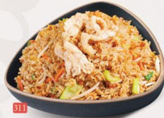
311 ارز مقلبي هونغ كونغ HONGKONG FRIED RICE ฿ 14/15/16/17/20 VEG/EGG/CHICKEN/BEEF/MIX