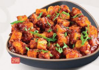
شيلي فطر CHILLY MUSHROOM ₹ 14.00