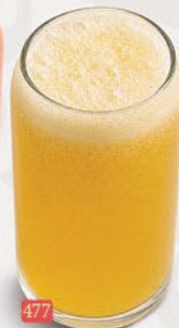
477 عصير سالو بيشن JUICE SALVATION ₹ 14.00