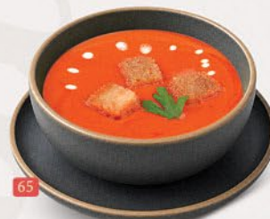
شوربة طماطم TOMATO SOUP ₹ 9.00