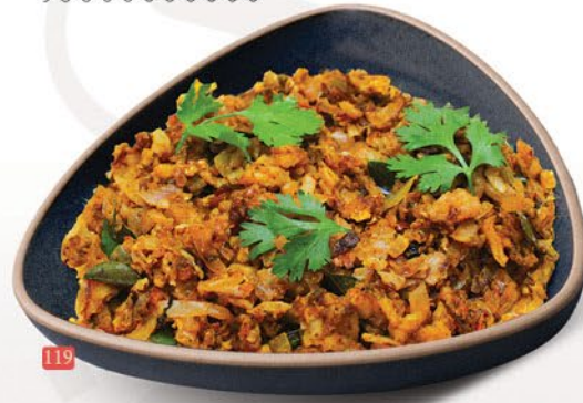
119 كوتو براتا دجاج/لحم بقر KOTHU POROTTA CHICKEN/BEEF ₪ 14/15