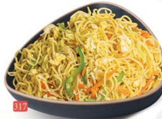
317 معدرنة بيض EGG NOODLES ฿ 15.00 ฿ 16.00 SCHEZWAN