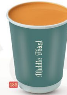
488 شاي كداك KADAK TEA ₹ 1.00