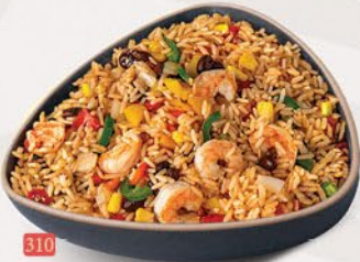
310 ارز مقلبي مكسيكي MEXICAN FRIED RICE ฿ 14/15/16/17/20 VEG/EGG/CHICKEN/BEEF/MIX