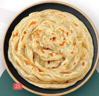
پراتا کیرالا KERALA POROTTA ₹ 1.50