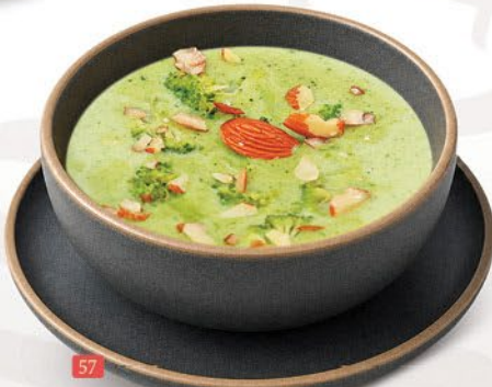
شوربة الموند بروكولي ALMOND BROCCOLI SOUP ₹ 12.00