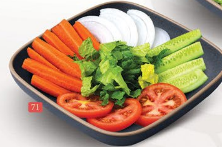
سلطة اخضر GREEN SALAD ₹ 10.00