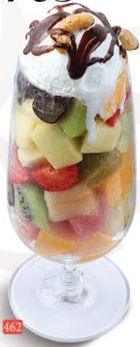
462 سلطة فواكه مع ايس كريم FRUIT SALAD W. ICE CREAM ₹ 14.00