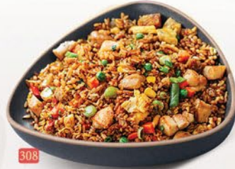
308 ارز مقلبي شانغهاي SHANGHAI FRIED RICE ฿ 14/15/16/17/20 VEG/EGG/CHICKEN/BEEF/MIX