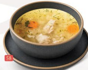
شوربة واضح CLEAR SOUP ₹ 9.00

Soup is a primarily liquid food made by simmering ingredients like meat, fish, or vegetables in stock, water, or milk. Ranging from light, delicate broths to thick, hearty purées, soups are a comforting, highly customizable staple served hot, warm, or chilled.