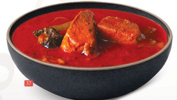
سمک مولاکيٹادو (ماتي/شورا) FISH MULAKITTATHU ( MATHI / CHOORA ) ₹ 10.00