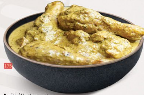
175 دجاج موغلاي/افغاني MUGHLAI/AFGHANI CHICKEN ₹ 18.00