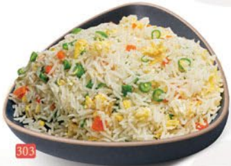
303 ارز مقلبي بيض EGG FRIED RICE ฿ 14.00 ฿ 15.00 SCHEZWAN