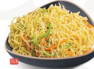
318 معدرنة خضار VEG NOODLES ฿ 15.00 ฿ 16.00 SCHEZWAN