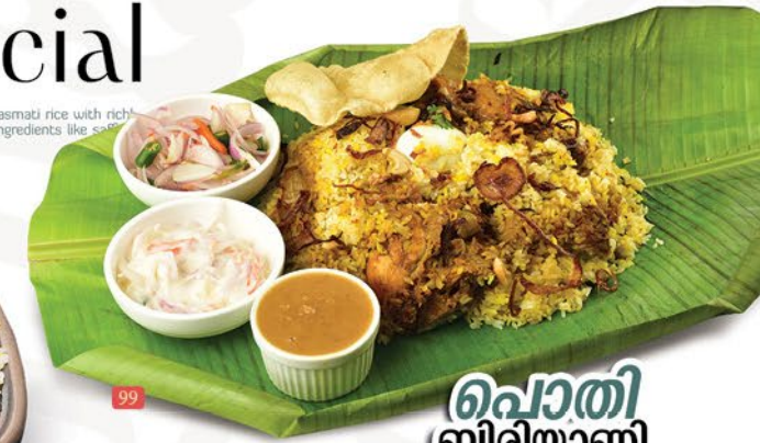
برياني دجاج بخار ملبار MALABAR CHICKEN DUM BIRIYANI ₹ 14.00