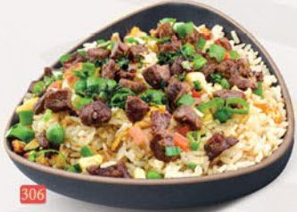
306 ارز مقلبي لحم بقري BEEF FRIED RICE ฿ 16.00 ฿ 17.00 SCHEZWAN