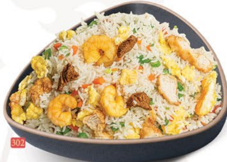
302 ارز مقلبي مشكل MIX FRIED RICE ฿ 18.00 ฿ 19.00 SCHEZWAN