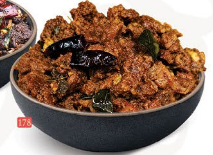
178 لحم بقر اولرتيادو BEEF ULARTHIYATHU ₹ 17.00