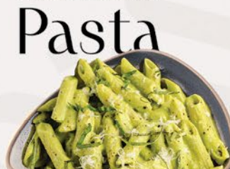
325 باستا بستو PESTO PASTA ฿ 16.00