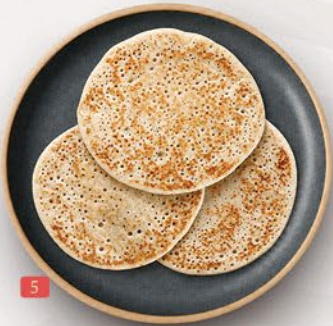
دوسا سيت DOSA SET ₹ 6.00