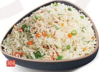
304 ارز مقلبي خضار VEG FRIED RICE ฿ 14.00 ฿ 15.00 SCHEZWAN