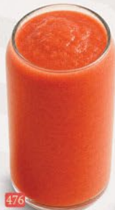
476 رائع القوة POWER BOOSTER ₹ 14.00