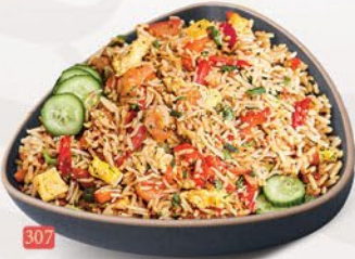
307 ارز مقلبي تاي THAI FRIED RICE ฿ 14/15/16/17/20 VEG/EGG/CHICKEN/BEEF/MIX