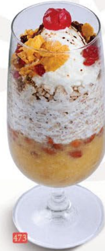
473 حليب أفيل AVIL MILK ₹ 10.00