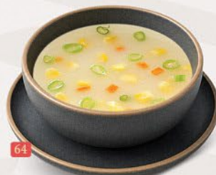
ذرة حلو خضار/دجاج SWEETCORN VEG./CHICKEN ₹ 9/10