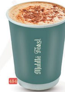
484 بوست BOOST ₹ 4.00