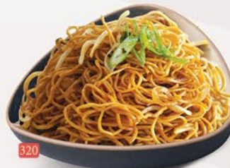
320 معدرنة هونغ كونغ HONGKONG NOODLES ฿ 14/15/16/17/20 VEG/EGG/CHICKEN/BEEF/MIX