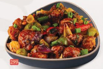
خضار مانشوريان VEG. MANCHURIAN ₹ 14.00