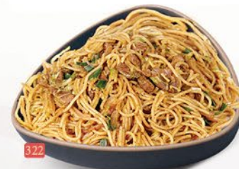
322 معدرنة شانغهاي SHANGHAI NOODLES ฿ 14/15/16/17/20 VEG/EGG/CHICKEN/BEEF/MIX