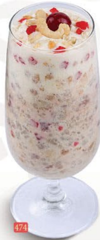
474 حليب أفيل جوز الهند TENDER COCONUT AVIL MILK ₹ 14.00