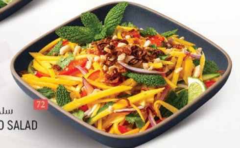
سلطة مانجو نيئة RAW MANGO SALAD ₹ 10.00