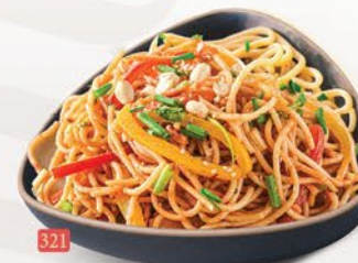
321 معدرنة تاي THAI NOODLES ฿ 14/15/16/17/20 VEG/EGG/CHICKEN/BEEF/MIX