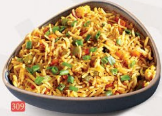
309 ارز مقلبي سينغافوري SINGAPORE FRIED RICE ฿ 14/15/16/17/20 VEG/EGG/CHICKEN/BEEF/MIX