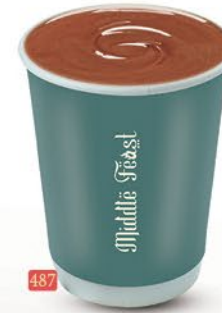
487 هوت شوكولاتة HOT CHOCOLATE ₹ 5.00