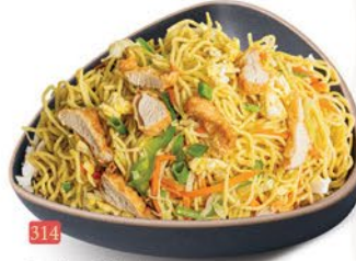
314 معدرنة دجاج CHICKEN NOODLES ฿ 16.00 ฿ 17.00 SCHEZWAN