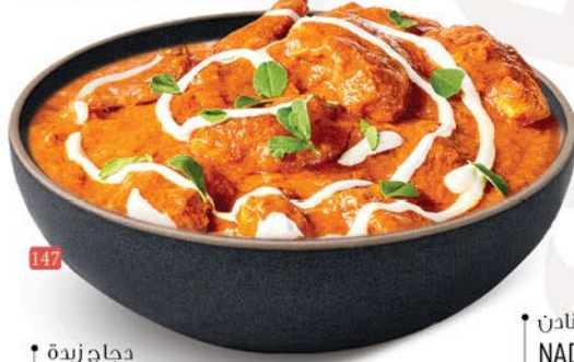
147 دجاج زبدة BUTTER CHICKEN ₹ 16.00

Indian cuisine is a vibrant, diverse tapestry of flavors known for its complex blends of spices, aromatic herbs, and regional diversity. Staples include legumes, rice, and wheat, shaped by slow-cooking techniques and centuries of cultural influences, creating a balance of savory, sweet, tangy, and spicy notes in almost every bite.