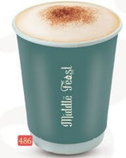
486 قهوة حليب طازج FRESH MILK COFFEE ₹ 3.00