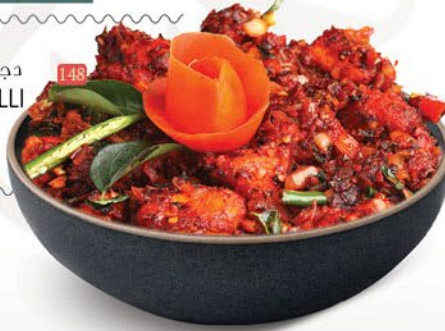
148 دجاج شيلي نادن NADAN CHILLI CHICKEN ₹ 16.00