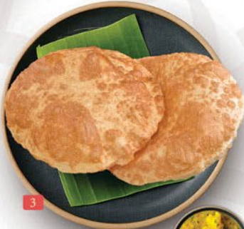
پوري باجی (3 قطع) POORI BHAJI (3 PCS) ₹ 6.00