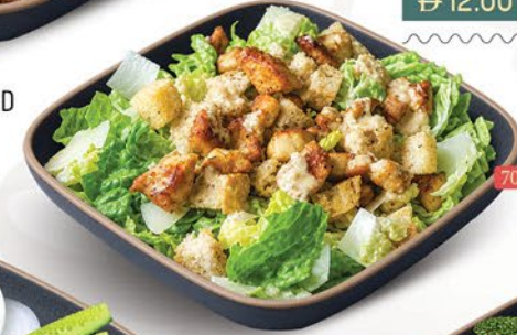
سلطة دجاج سيزر CHICKEN CAESAR SALAD ₹ 12.00