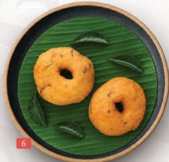
فادا سيت (2 قطع) VADA SET ( 2 PCS ) ₹ 5.50